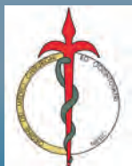
Ordine dei Medici Chirurghi ed Odontoiatri di Trieste