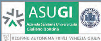
REGIONE AUTONOMA FRIULI VENEZIA GIULIA ASUGI - Azienda Sanitaria Universitaria Giuliano-Isontina